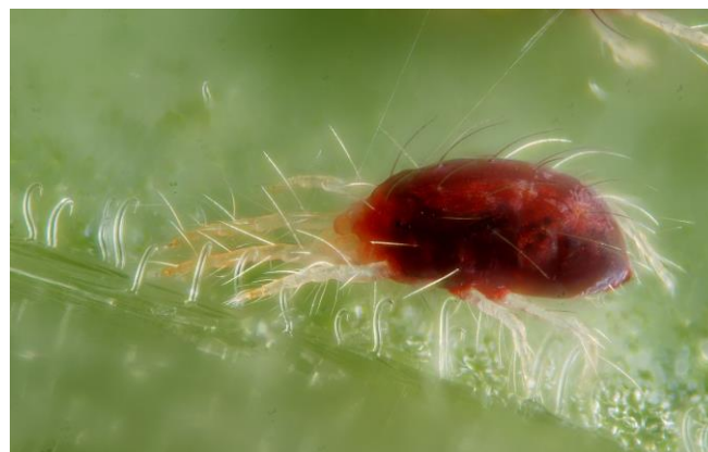
Figura 1. Tetranychus urticae con hilos de seda.

Las plagas son un problema mundial, pues representan una disminución del rendimiento de producción de entre 20 y 30%. Se calcula que existen 67,000 especies de plagas que dañan los cultivos agrícolas. En México, por ejemplo, el gusano cogollero del maíz ( Spodoptera frugiperda ), la mosca de la fruta ( Drosophila melanogaster ), el picudo algodnero ( Anthonomus grandis ), la araña roja ( Tetranychus urticae ), la mosca blanca ( Aleyrodidae ) y el pulgón ( Aphididae ) son las plagas más importantes que atacan los cultivos (Alatorre, 2014; Nava-Pérez et al., 2012).